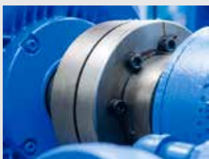
Sistemas de alineación

Sistemas de medición láser y servicios para una óptima alineación de máquinas e instalaciones.