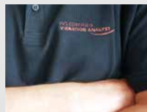
Asistencia al cliente

Sistemas y servicios para el aseguramiento de la calidad y el control de procesos en la producción de productos semielaborados.