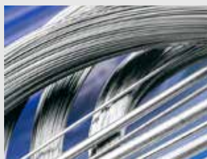
Ensayo no destructivo de materiales

Sistemas de medición de vibraciones para la supervisión de máquinas e instalaciones, además de servicios como el diagnóstico de problemas en las máquinas.