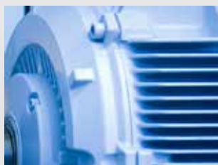
Monitoreo de condiciones

Sistemas de medición láser y servicios para una óptima alineación de máquinas e instalaciones.